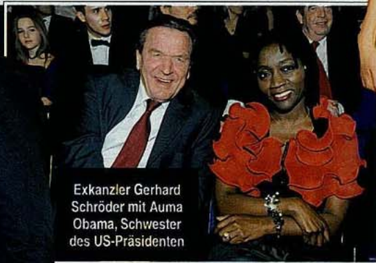
Exkanzler Gerhard Schröder mit Auma Obama, Schwester des US-Präsidenten