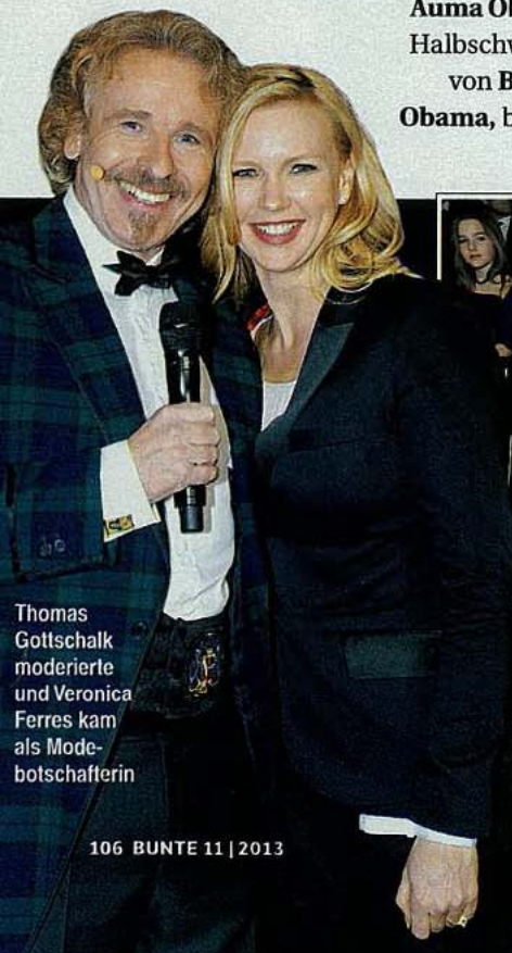
Thomas Gottschalk moderierte und Veronica Ferres kam als Modebotschafterin